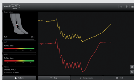
Fase di acquisizione