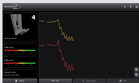
Fase di esercizio

Il Venoscreen Plus è un dispositivo intuitivo, facile e pronto all'uso. Dispone di una stampante termica integrata e di un tablet touch screen per eseguire l'esame, visualizzare le misure e i risultati.